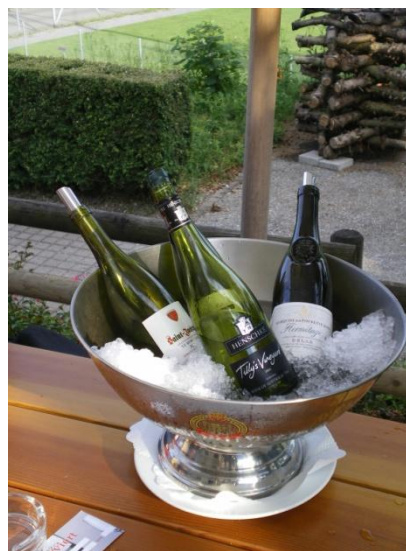
Der Aperero auf der Terrasse der Schönegg wurde nicht nur dank der strahlenden Sonne zum Erfolg

Die Verkostung begann kurz nach 19:00 auf der Terrasse des Schönegg-Restaurants. Die 14 Teilnehmer und Teilnehmerinnen freuten sich einerseits auf das Wiederzusammentreffen bei so einem Wetter, andererseits auf die bekanntgegebene Weinliste, wobei die Aperoweine bereits Anlass zu einer freundlichen Gegenüberstellung gaben. Zwei Mal Australien, zwei Mal Rhône-Tal, was konnte man sich zu diesem Zeitpunkt mehr wünschen? Aus der französischen nördlichen Region präsentierten sich zwei stolze Kandidaten, deren geographische Nähe sich eigentlich überhaupt nicht in den respektiven Weinen widerspiegelte. Genau 4.5 Kilometer trennen beide Gemeinden voneinander, wo sich die Weingüter befinden. Aber analog Queensland und dem Rest Australiens trennten Welten die zwei Weissweine.