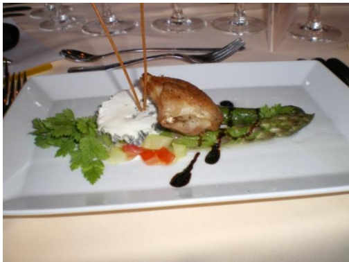
Die raffinierte erste Vorspeise

Im Rahmen der Syrah gegen Shiraz Verkostung wurden die Gäste mit einem reichhaltigen, 5-Gang Menü Diner verwöhnt: