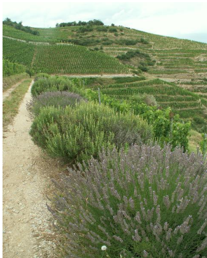
Lavendel und Rosmarin im Weinberg von Hermitage

Die Gesamtfläche des Hermitage blanc kann auf 30 Ha. eingeschätzt werden, wobei der Ertrag 36 Hl/Ha nicht überschreiten darf.