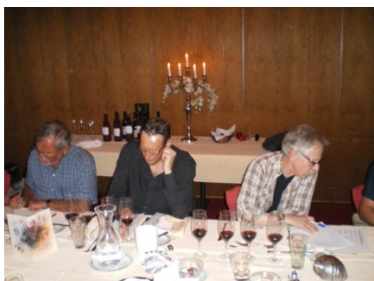
Drei leidenschaftliche Geniesser bewerten mit unvergänglicher Ernsthaftigkeit

Für die nördliche Rhône erteilt Parker beiden Jahrgänge 1995 und 1997 eine globale Note von 90. Diese zwei Weine, La Chapelle und Château d'Ampuis, sind m.E. höher einzustufen.