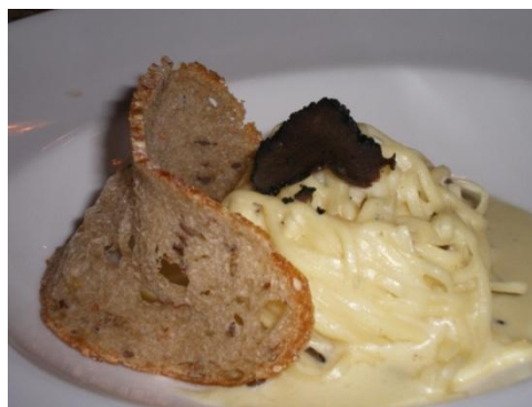
Die ausgesuchte erste Vorspeise mir der Trüffel