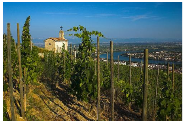
Die Sankt-Christoph Kapelle

Die Appellation namens Hermitage geniesst vor allem für seine Rotweine einen hervorragenden Ruf weltweit und die Behauptung, die Preise seien richtig günstig im Vergleich zur Qualität der Erzeugnisse, ist daher gar nicht übertrieben. Die weissen Hermitage gelten als Raritäten, der Bekannteste, der Chevalier de Stérimberg von Jaboulet, ist heute bestimmt nicht der Beste und die Anderen sind in der Schweiz entweder fast unfindbar oder keiner versteht deren Preise. Eine Ausnahme wäre der monumentale Hermitage blanc von Tardieu-Laurent , einem Händlerhaus 7 , das seit längstem auf die allerhöchste Qualität setzt. Bisher konnte mich der weisse Hermitage von Guigal nicht wirklich überzeugen (im Gegensatz zu seinem fabelhaften Condrieu la Doriane oder zum Mythos nahestehenden Hermitage Ex-Voto ).