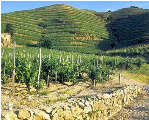
Die Lage Les Bessards

zwei ersten „Viertel“ bilden den qualitativen Kern der Appellation), Les Greffieux und L’Hermitage (für beide Farben) ermutigt die Winzer, Weine einzelner Lagen auszubauen.