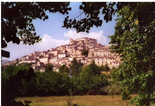
Im Film Ratatouille ist die Rede vom Safran aus der Abruzzen. Dieser kommt von Novelli, eine kleine Gemeinde in der Nähe von L'Aquila, der Hauptstadt der italienischen Provinz.

jenige, die ihm Slow Food Italien 12 erteilte, waren die Belohnung für seine leidenschaftliche Arbeit. Letztlich erkor ihn der Verband der italienischen Sommelier ( AIS ) mit 5 Grappoli (Reben – höchste Auszeichnung des AIS) für den Montepulciano d'Abruzzo Villa Gemma Rosso 2005 aber auch für den Montepulciano d'Abruzzo Marina Cvetic 2005 . Neben Masciarelli hieven Winzer wie Illuminati (tolle Zanna und Lumen ), Valle Reale (genialer San Calisto 13 ), die diskrete Azienda Vinicola Valentini (für ihren Trebbiano) und Bruno Nicodemi (für seinen Montepulciano Colline Teramane Neromono) die Fahne der Wiedererstehung der Weine aus den Abruzzen . Die Mitglieder der Club les Domaines wurden 2007 mit einem schönen Paket der Valentina beliefert und beglückt. La Valentina bietet einen schönen Eintritt in die Welt der guten Winzer aus den Abruzzen. Der Belovedere sowie der Spelt beweisen beide, dass die autochthone Rebsorte, der Montepulciano, die Erzeugung roter Weine, die international einen sehr guten Platz verdienen. Der Gambero Rosso bezeichnet sogar diese Rebsorte als durchaus fähig, Weine unter den Allerbesten auf der Welt zu erzeugen.