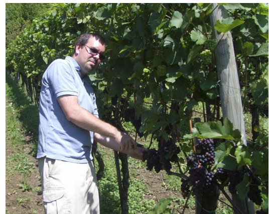
Die Arbeit im Weinberg

Es hängt dann vom Deal ab, wie viel ich im Rebberg selber mache. Beim 2008er Sauvignon blanc habe ich zum Beispiel die Ertragsregulierung und das sehr sanfte Entblättern in der Traubenzone selbständig gemacht. Ich bin aber sicherlich alle zwei Wochen im Rebberg, um mir den Stand der Reben und der Arbeit anzuschauen. Vertrauen ist gut, Kontrolle ist besser. Bisher hatte ich immer ein glückliches Händchen mit den Verkäufern, sprich wurde immer die geforderte Qualität erreicht. Sollte das in einem Jahr nicht der Fall sein, kaufe ich auch die Trauben nicht.