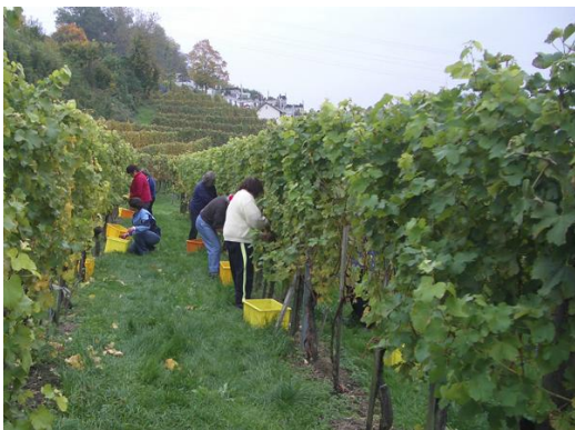
Ernte in Neftenbach

Meine Weine keltere ich aus zugekauftem Traubengut in 1A-Qualität. Bei den Jahrgängen 2008 und 2009 waren dies Trauben aus den beiden Zürcher Gemeinden Neftenbach und Weiningen. Dies waren die Traubensorten Pinot noir , Sauvignon blanc und Kerner . Ich möchte in Zukunft aber auch gerne einmal einen Merlot aus dem Tessin, einen Chasselas aus der Westschweiz sowie einen Riesling aus der Mosel keltern. Darum habe ich keine eigenen Rebberge, ich lasse mich ungern einschränken, sprich mir fehlen die finanziellen Mittel in halb Europa hier und dort eine Reblage zu erstehen.