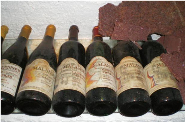
v.l.n.r.: Malanser Blauburgunder Reserve Barrique 1988 und 1990 sowie vier Flaschen Malanser Cabernet Sauvignon Reserve Barrique