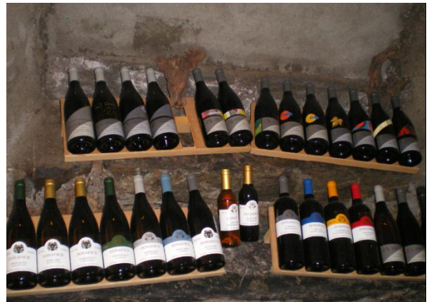
Eine breite Weinreihe

Rebsorten wie der Sauvignon Blanc aber auch der Cabernet Sauvignon würden in den kommenden Jahren durch Pinot Noir und Chardonnay ersetzt. Wenn die zwei Rebsorten von Bordeaux zwar die Erzeugung spannender Weine ermöglichen würden, müssten die so erfolgreichen Rebsorten des Weinguts bevorzugt werden. Tradition, Passion und Unique, so gibt sich die Weinreihe an. Komplizierter müsse es nicht sein.