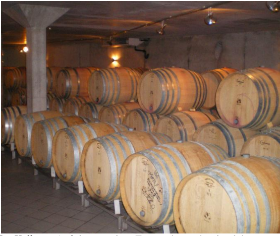
Im Keller... Auf dem zweiten Fass rechts steht eine lobenswerte Widmung