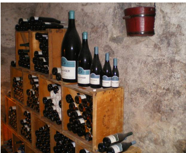
Durch das Labyrinth...