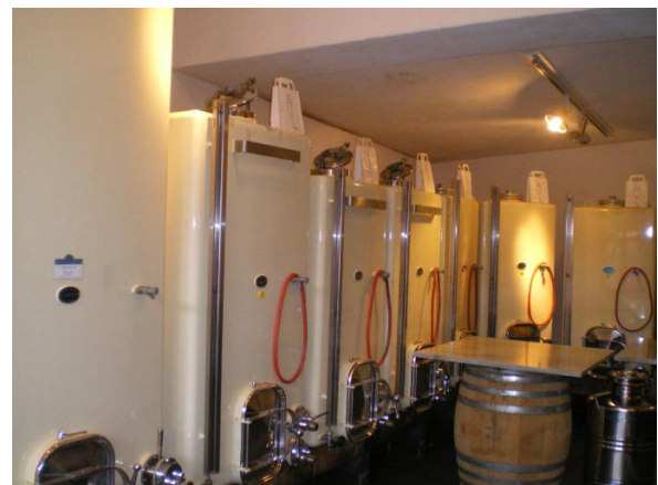
Im „Torcel“ werden die weissen Reben gepresst und die blauen Trauben vor der Vergärung zerquetscht

Die 225 Liter Fässer, in denen der Pinot Noir Unique und der Chardonnay Unique vergären, werden jedes Jahr vollständig ersetzt. Die Fässer der Passion-Weine sind zu ca. 30% neu, für 30% erfolgt die zweite Füllung und für 30% die dritte. Die Tradition-Weine und die übrigen Erzeugnisse werden in bereits gebrauchten Fässern ausgebaut. Der Ausbauprozess erfolgt nach burgundischer Art, wobei die Absicht darin besteht, dass die Weine möglichst wenig holzbetont werden. Die Reben der verschiedenen Lagen werden jeweils separat ausgebaut. Anschließend erfolgt die Lagerung in Eichenfässern.