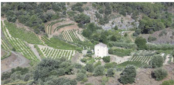
Die Weinberge von Torroja