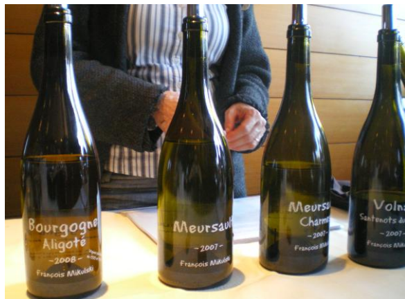
Die Weine, welche März 2010 vorgestellt wurden.

Wie Meursault Goutte d'Or 2008 aber etwas mehr Frucht. 17/20