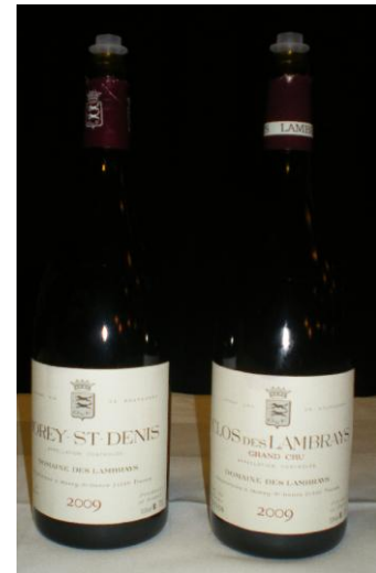
Genauso wie seine Vorgänger wird der Jahrgang durch eine sensationelle Präzision ausstrahlen.