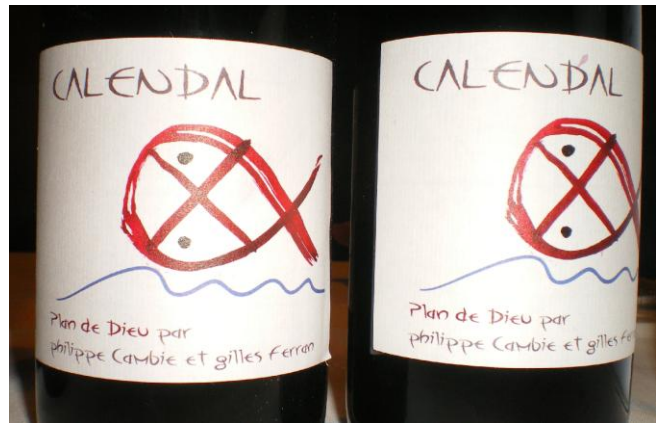
Die Etikette wurde durch die Tochter von Gilles Ferrand gezeichnet.

Das ganze Können von Philippe Cambie und seinem Freund Gille Ferrand steckt in diesem Plan de Dieu, einer buchstäblich von Gott begnadeten Lage. Ausschliesslich aus alten Grenache und Mourvèdre Trauben gewonnen. So eine Wucht, so eine Kraft, die CdR, wie sie freundschaftlich genannt werden, lernen den anderen Weinen des südlichen Rhône-Tals das Fürchten. Unglaublich, aber auch ganz und gar nicht falsch! Sogar Parker hat sich nicht verirren lassen und bewertet den Jahrgang mit 92/100. 18/20