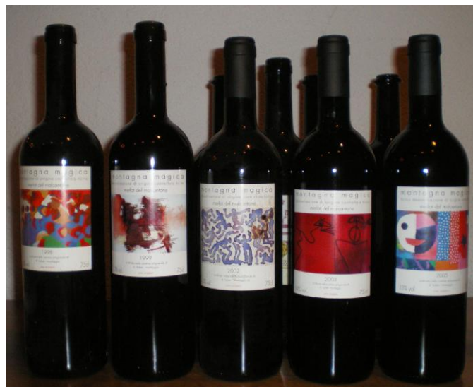
Am 4. Februar 2011 organisierte Wein-Events eine unvergessliche, dreifache Verkostung von Montagna Magica, Orizzonte und Pio della Rocca & Friends (Bericht folgt später)

Im Bouquet viel Fruchtsüsse, florale Noten (Veilchen). Im Gaumen Holzeinfluss der Barriques gut spürbar (Vanille), schöne Länge im Abgang. Noch drei Jahre warten mit Trinken. 17/20