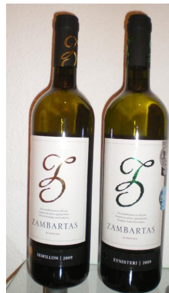
Beide Weissweine von Zambartas: Der Semillon 2009 und der Xynisteri 2009