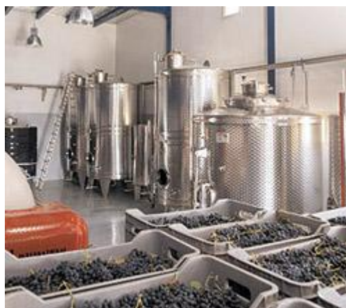
Der moderne Weinkeller