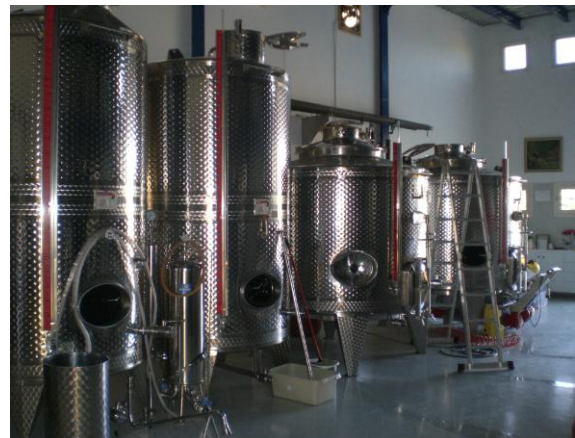
The modern winery installation