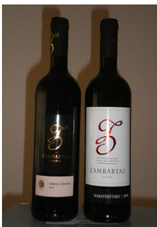
Der Lefkada-Shiraz 2008 und der Maratheftiko 2008