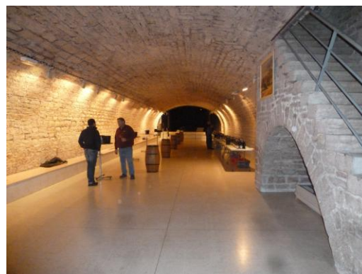
L'Espace Chambertin à Gevrey-Chambertin