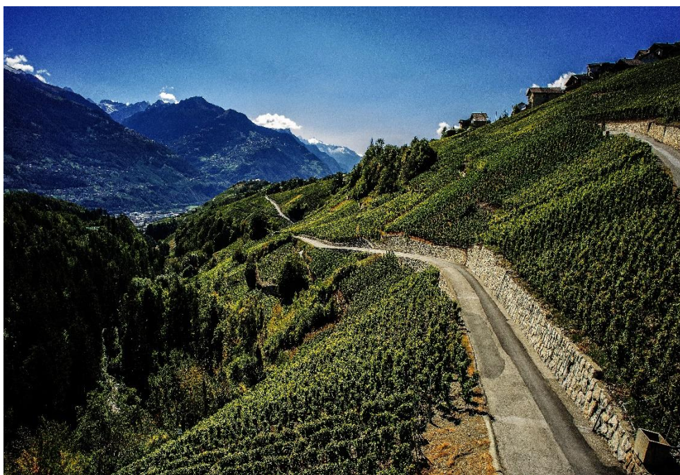
Electus, un vignoble

Nous ne pensons pas que la question se pose encore aujourd'hui de savoir si Electus coûte un prix exorbitant. Pourquoi un consommateur aisé serait-il prêt à payer plus de 150 francs suisses pour un bon second cru de Bordeaux ou un Supertoscan mais ne le serait-il pas pour dépenser le même montant pour une bouteille d'Electus? La confrontation du 13 septembre 2017 entre Electus 2013 et dix vins de grand calibre international du même millésime a montré que ces vins sont effectivement comparables. Ou l'incohérence, outre le snobisme, est-elle un autre trait de caractère de tant de connaisseurs ?