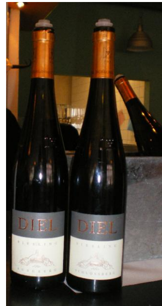
Die Verkostung der Grossen Gewächse 2009 am 30. Sept. 2010 im Caduff's Wineloft