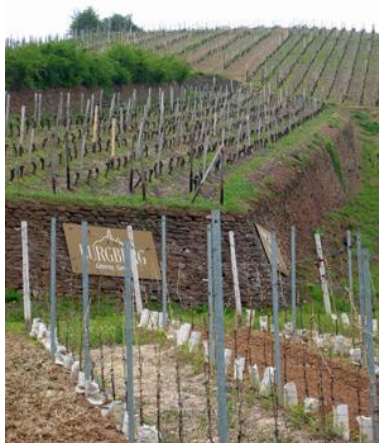
Die Lage Burgberg

Der trockene Schlossberg GG 2009 ist ein würdiger Vertreter der deutschen Weinkategorie Grosses Gewächs, zeigt dennoch eine andere Dimension als der Burgberg. Im vielschichtigen Bouquet fällt die schöne Würze unmittelbar auf. Der wiederum würzige Körper wirkt üppiger und weniger streng, aber vielleicht auch weniger gnadenlos und komplex als beim Burgberg. Dafür erweisen sich die Rasse und die Konsistenz des Schlossbergs als eindeutig. Ein toller, durchaus gelungener Wein, den wir mit 17/20 bewerten.