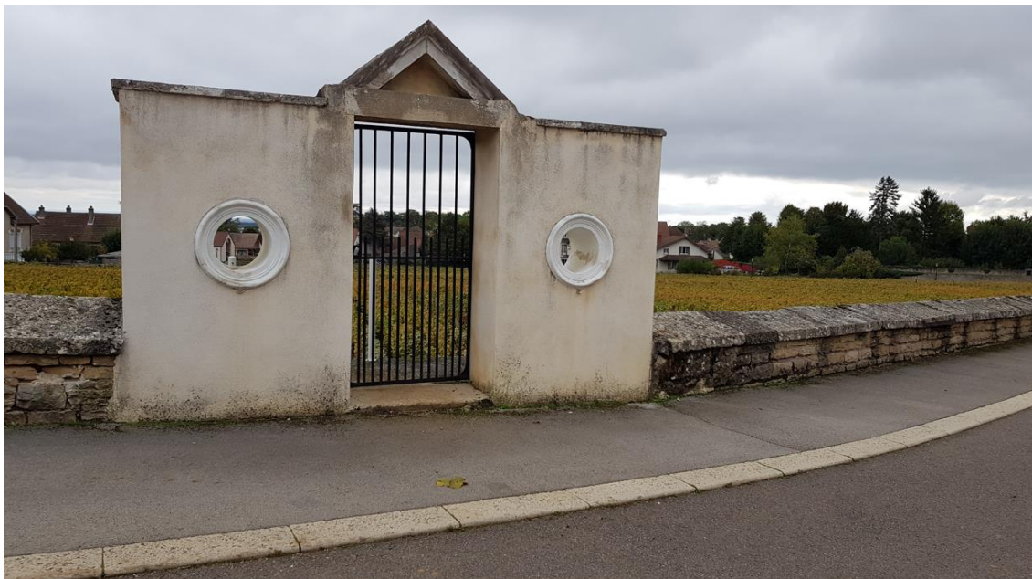
Die Lage Clos Villages