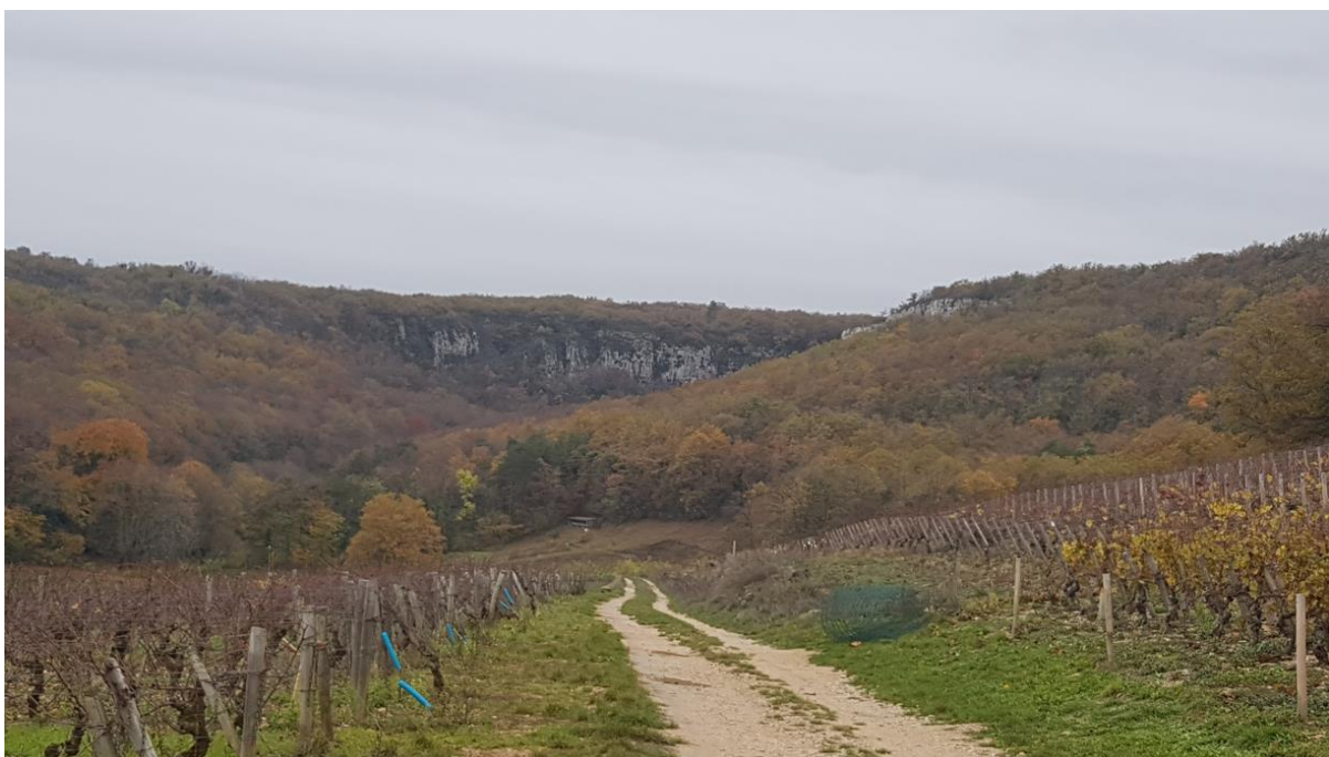
Die Combe de Lavaux (dt. Die Schlucht von Lavaux). Mehr Infos : Link

Der vorliegende Text ist zur exklusiven Publikation auf www.vinifera-mundi.com und www.vinifera-mundi.ch vorgesehen. Weitere Nutzungen sind mit den Urhebern vorgängig abzusprechen. Jeder Empfänger verfügt über das Recht, den vorliegenden Bericht an Drittpersonen weiter zu senden.