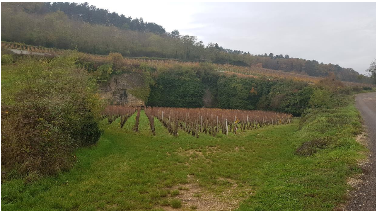
Im Hintergrund die 1er Cru Lage Les Goulots