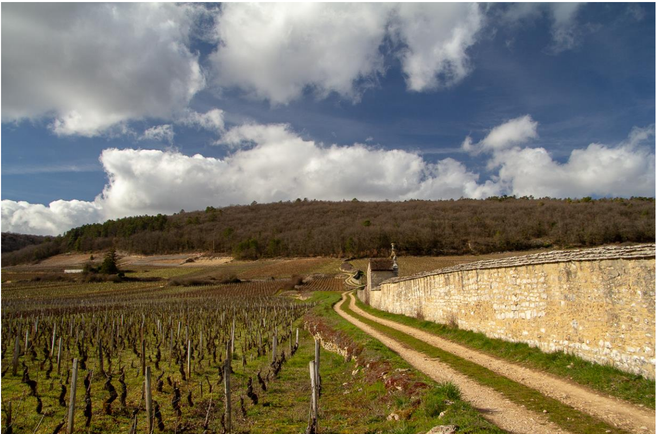
Die 1er Cru Lage Lavaut Saint-Jacques