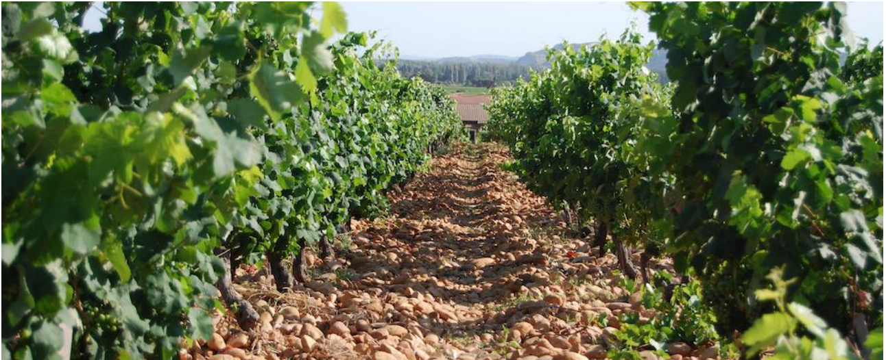
Das Terroir von La Crau

Im ziemlich monolithischen, dennoch auch tiefsinnigen, lebhaften und frischen Bouquet verströmen Aromen schwarzer Beeren, Johannisbeeren, von Rotbeeren und Garrigue und einer Vielfalt südlicher Kräuter, nicht zuletzt von feinem, subtil eingebundenem Holz. Wir befinden uns ganz eindeutig im Mittelmeerraum. Das Ganze wirkt aktuell relativ kompakt und gnadenlos. Geniesser, welche Weine ohne Ecken und Kanten lieben, dürften sich über dieses Erzeugnis sehr freuen. Insbesondere, weil der Gaumen enorm viel Spass bereitet. Er zeigt sich fleischig, geschmeidig, kräftig und relativ satt, die Tannine wirken wie Seidenpapier, sie sind extrem feingliedrig und fruchtig, die Säure ist wunderschöne eingebunden und verleiht dem Wein eine heilbringende Frische, der Abgang entwickelt sich grossartig und würzig. Eindeutig ein einzulagernder Wein. 18/20