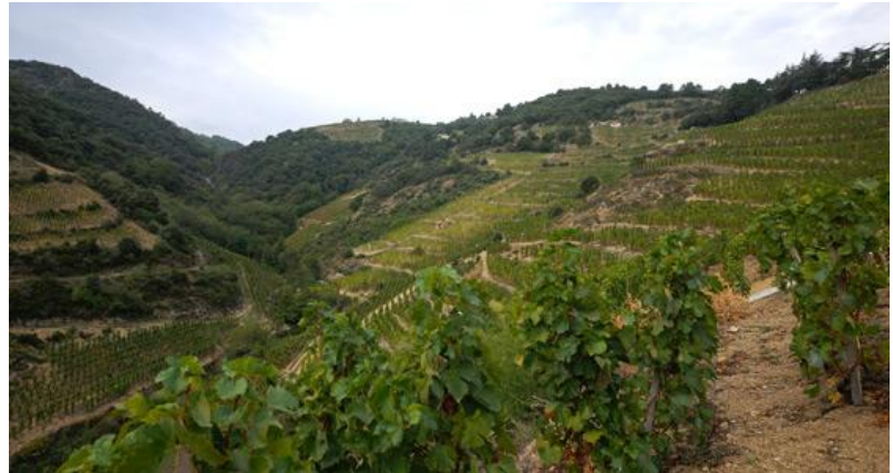
Der Rebberg von Clape

(ah) - 100% Syrah, 20-30 jährige Reben (bemerkenswert ist, dass die Rebstöcke nie ein genaues Alter haben, sie sind entweder 10 oder 20 oder 30 usw. Jahre alt. Clape zählt das Alter seiner Rebstöcke in Dekaden). Die Farbe ist ein üppiges, Purpur-Rubin. Das Bouquet zeigt sich ziemlich verschlossen aber süsse Beerenfrucht ist auch hier erkennbar. Im Gaumen Tannin-betont aber es ist auch viel Beerenfrucht vorhanden.