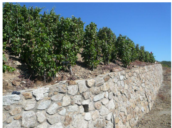
La Viallière

(ah) - 100% Syrah. 2009 wird der «La Viallière» zum ersten Mal eigenständig abgefüllt. Bis zum Jahrgang 2008 war er Teil des Lagencuvées «Champin le Seigneur». Die Farbe ist ein leuchtendes Purpur-rubin. Das Bouquet zeigt sich zurzeit recht verschlossen. Etwas Beerenfrucht, mineralische Noten und sanfte Toastaromen. Im Gaumen üppig und abgerundet. Die Säure ist noch klar präsent. Zurzeit sind die Aromen noch im Säurekorsett eingesperrt, aber das Potential für Grösse und Aromavielfalt ist eindeutig vorhanden. Mittellanger Abgang. 17+/20. Einlagern und in 10 Jahren als Rarität geniessen.