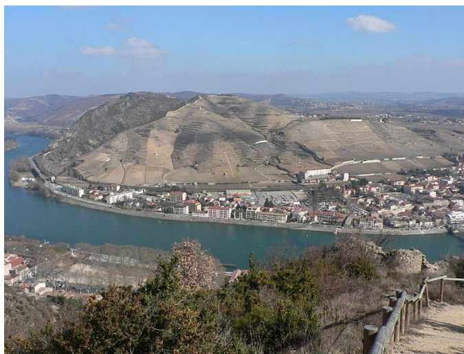
Der Hügel von Hermitage von Tournon her

Hermitage ist unbestritten eine der beiden Kultappellationen im französischen Rhône-Tal. Wer zu diesem Thema aber Informationen im Internet sucht, wird schnell enttäuscht: Kaum ein tauglicher Inhalt kann gefunden werden. Einmal ein grandioses Museum in St Petersburg, einmal eine interessante Stiftung in Lausanne (mit immer wieder tollen Kunstausstellungen), welche mit der Winterthurer Kunstsammlung und Ausstellung Römerholz von Oskar Reinhard verglichen werden könnte. Dies sind die Ergebnisse einer Suche im Internet zum Thema Hermitage. Nicht einmal die Webseite www.thehermitage.org führt zur gewünschten Information, sondern zu einem Museum in New Jersey über den Sezessionskrieg. Benötigt diese AOC tatsächlich kein Marketing oder wurden die entsprechenden Anstrengungen bloss unterlassen? Zur Kollektivrettung der deutschsprachigen Weinliebhaber gibt es die relativ kurze, dennoch zielführende Webseite von Wikipedia „ Hermitage Wein “. Hingegen kann denjenigen, welche Französisch zumindest lesen können, die hervorragende, 230seitige Ausgabe Nr. 60 (Februar 2010) des e-Magazine TAST von Michel Bettane und Thierry Desseauve wärmstens empfohlen werden.