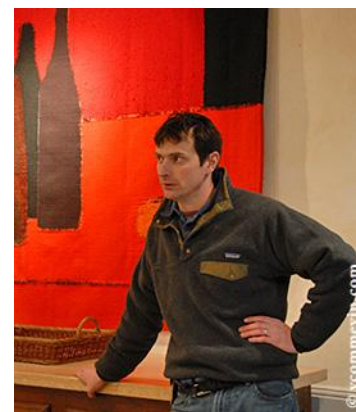
© V comme Vin . Jean Louis Chave

Im März 2011 veröffentlichten wir einen Bericht über eine Vertikalverkostung der Hermitage Weine von Jean-Louis Chave , in welchem wir eine ausführliche Präsentation des Weinguts hinzufügten. Zusätzlich stellten wir die verschiedenen Lieux-dits [offizielle Bezeichnung im Anbaugebiet für „Climats“, Anm. der Red.] sowie den grossen Unterschied zwischen beiden Produktionsmethoden resp. Ansätze der Appellation, einerseits der Kultur der Assemblage, wie es u.a. bei Jean-Louis Chave praktiziert wird, andererseits diejenige der Herausstellung der Lagenweine einzelner Climats, wie es u.a. Michel Chapoutier mit seinen Selections Parcellaires bevorzugt, gegenüber. Im vorliegenden Bericht verzichteten wir also darauf, diese wertvollen Informationen nochmals aufzuführen, und konzentrieren uns stattdessen auf die 20 Weine der Verkostung. Diese fand am 15. September 2012 im Restaurant Braui, Hochdorf, statt. Der Anlass wurde durch Baschi Schwander organisiert. Jede Serie wurde chronologisch, dennoch blind