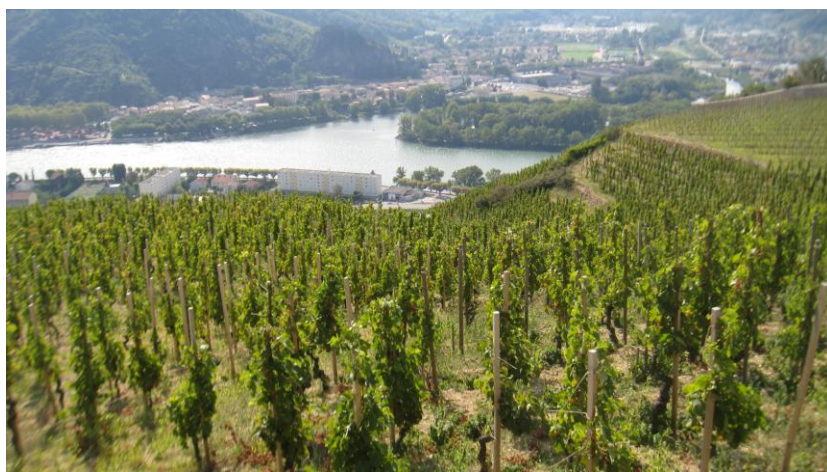
Das Lieu-dit Les Bessards