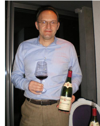
Ivan Barbic spendete die acht Jahrgänge Hermitage Jean-Louis Chave sowie die Piratflasche

Robert Parker bezeichnet sich als unwandelbarer Liebhaber der Weine von Jean-Louis Chave. Abgesehen von einzelnen Jahrgängen, bei welchen die umwerfende Delikatesse des Hermitage eine unüberwindliche Herausforderung gebildet hat, wurden/werden die Weine stets mit beneidenswerten Noten bewertet. 1986, 1987, 1991, 1992 und 1993 wurden mit 88 bis 89/100 bewertet, dem 1984er wurden 78/100 erteilt, während allen anderen Jahrgängen der letzten 30 Jahre zwischen 93 (1985 und 1996 wurden mit 91/100 bewertet) und 100/100 erteilt wurden. Spannend ist die Preisentwicklung. Robert Parker wird stets vorgeworfen, die Preisspirale zu fördern. Die Bordeaux-Winzer haben mit dem Jahrgang 2009 bewiesen, dass sie auf den amerikanischen Weinexperten nicht angewiesen sind, um den Realitätssinn zu verlieren. Umgekehrt benötigen die Weinliebhaber nicht die Bewertungen von Parker, um die Preise der Hermitage von Jean-Louis Chave auf einem stolzen Niveau aufrechtzuerhalten. Der Schätzwert des Jahrganges 1991 ist in den letzten zwei Jahren deutlich gestiegen, um aktuell ein Niveau von €140.- bis €186.- erreicht zu haben. Abgesehen vom 2003er (Parker 100/100) und vom 1990er (99/100) wird kein Jahrgang so hoch eingeschätzt.