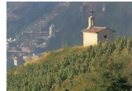
La Chapelle Saint Christophe überragt die Rhône

Blindverkostung durchzuführen. Die Weine wurden in drei Serien à je drei Jahrgänge ausgeschenkt. Alle Flaschen wurden kurz vor der Verkostung entkorkt und nicht dekantiert. Die Enthüllung der Flaschen am Schluss der Verkostung löste das Rätsel auf: In der ersten Serie wurden die Jahrgänge 1984, 1986 und 1987 serviert, in der zweiten 1992, 1993 sowie die Piratenflasche und schliesslich in der dritten Serie 1988, 1994 und 2001.