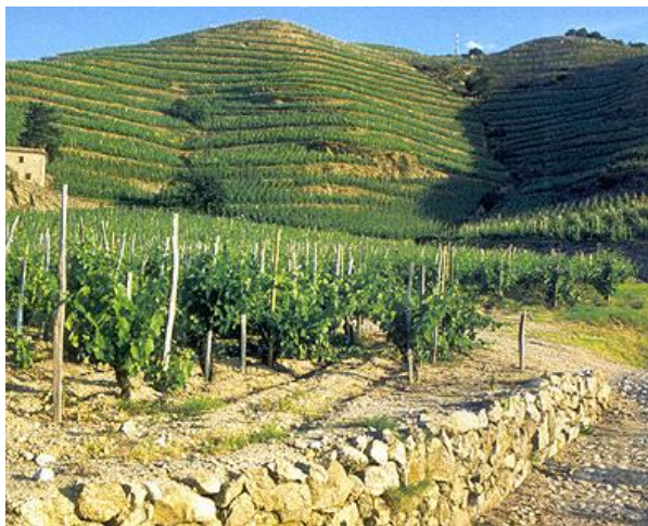
Die Lage Les Bessards