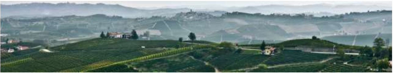
Landschaft in Barolo...