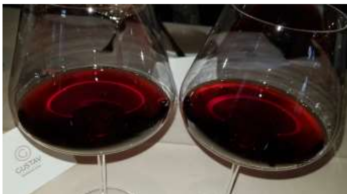
v.l.n.r. Cannubi 2009 und 2011

Elegante, geschliffene Nase mit einer grossartigen Komplexität und nicht weniger Tiefsinn. Zeigt eine klare Steigerung gegenüber dem Cannubi, breit, warm, generös und mit einem verführerischen Raffinement. Es strömen vielschichtige Düfte nach sehr reifen, dunklen Beeren, Pflaumen, sogar etwas Dörripflaumen, Kirschen, Leder, Nelken, Tabak und einem Hauch Trüffel. Mit der Zeit kommt sogar Kakao zur Geltung. Es gibt eine unverwechselbare Klasse in diesem Bouquet, welche nicht gleichgültig lässt. Eleganter, üppiger Antrunk. Finessenreicher, seiger/samtiger, geschliffener und vollmundiger, warmer Gaumen, welcher zeigt, dass wir ein Erzeugnis aus einem sonnigen Jahrgang verkosten. Komplexe und reintönige Aromen, welche eine sehr schöne Harmonie mit den Düften im Bouquet aufweisen. Runde, konzentrierte, ausgefeilte Tannine, einfach betörende Zusammensetzung mit einer grossartigen Eleganz und einem sehr langen Abgang. Eine Welt für sich. 18.5/20 (95/100).