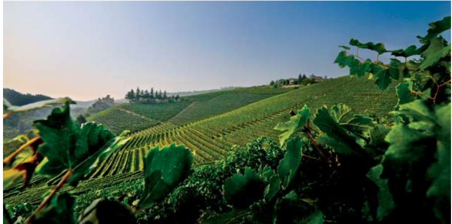
Die Lage Cerequio

Dazu gehören einige weltweit renommierte Lagen, deren Namen sofort die Eleganz und Langlebigkeit des hier geborenen Barolos in Erinnerung rufen. Die wichtigste Lage ist sicher der Hügel von Cannubi, die herausragende Barolo-Lage, von der die beiden Spitzen-Crus des Hauses stammen. Ausserdem besitzt Damilano weitere Rebflächen, die dank ihres Mikroklimas und der speziellen Böden die Produktion von Barolos wie Brunate und Cerequio mit ausgeprägter Persönlichkeit möglich machen.