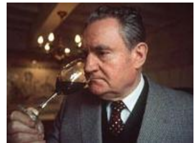
Emile Peynaud