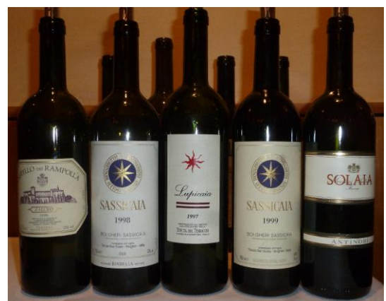
Sassicaia 1998 und 1999 in der Verkostung „ Toskana vor 2004 “ des Best Bottle Circle

„So eine geniale, frische und jugendliche Nase mit Schwarzen Beeren, Kirschen, Minze, etwas Tabak und Kaffee, laktischen Noten, ... Komplex und anregend, sehr subtil und fast unauffällig. Der Gaumen bietet etwas wie Winterspeck, wirkt schlaff und etwas introvertiert. Dekantieren würde diesen Wein bestimmt zu einem Höhenflug antreiben, denn der Stoff dazu ist klar vorhanden. 18/20. Publikumsbewertung: 18.2/20 (5. Rang).“