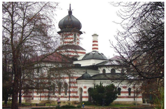
Die Donauebene ist nicht nur das Anbaugebiet einiger, vielversprechender Weingüter, sondern auch ein wichtiger Kulturraum, wie z.B. hier Plevna