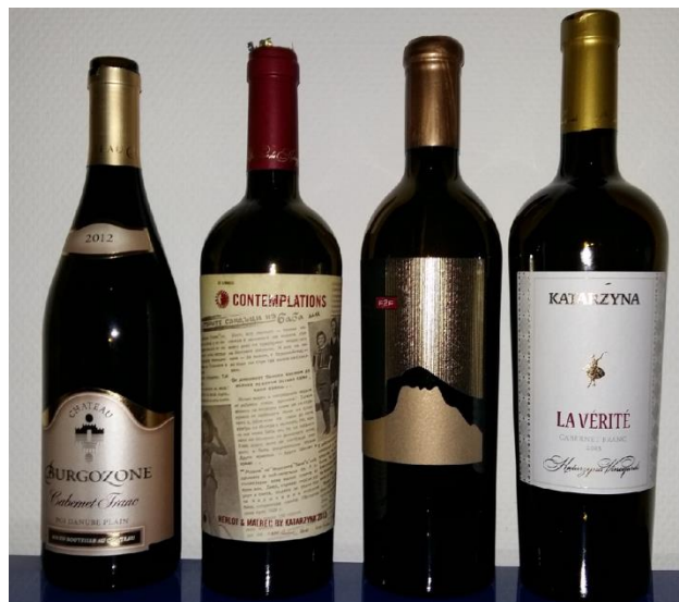
Die vier genialen Rotweine, welche jeder Weinliebhaber entdecken müsste.

Bis vor 25 Jahren wurde die Produktion an die Mitglieder des Comecon verkauft. Aspekte einer gesunden Marketingstrategie existierten nicht, wobei diese bereits bei der Qualität der Weine angefangen hätte. Sauberkeit? Fremdwort, Lückenlosigkeit in der Herstellungskette? Dito,... Kolchosen haben immer andere Prioritäten gehabt. Unsere tiefe Überzeugung ist, dass Bulgarien noch lange mit seinen persönlichen Dämonen kämpfen wird. Nicht vergessen werden darf die Tatsache, dass die National Vine and Wine Chamber (NVWC) die besten Produzenten des Landes vereint. Und auch bei diesen sind wir immer wieder auf Probleme gestossen, welche nicht sein dürften. Dementsprechend können wir zum heutigen Tag zwei Weingüter besonders empfehlen, Katarzyna und das Château Burgozone.