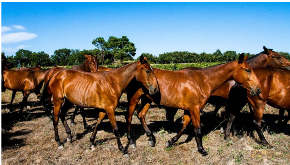
Lusitano-Pferde im Tejo-Gebiet