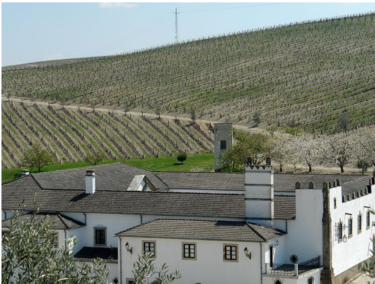
Quinta dos Aciprestes

Der vorliegende Text ist zur exklusiven Publikation auf www.vinifera-mundi.com und www.vinifera-mundi.ch vorgesehen. Weitere Nutzungen sind mit den Urhebern vorgängig abzusprechen. Jeder Empfänger verfügt über das Recht, den vorliegenden Bericht an Drittpersonen weiter zu senden.