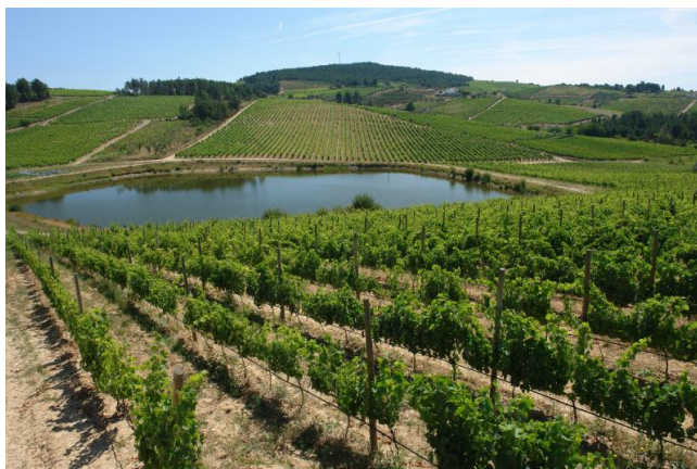
Quinta do Casal da Granja