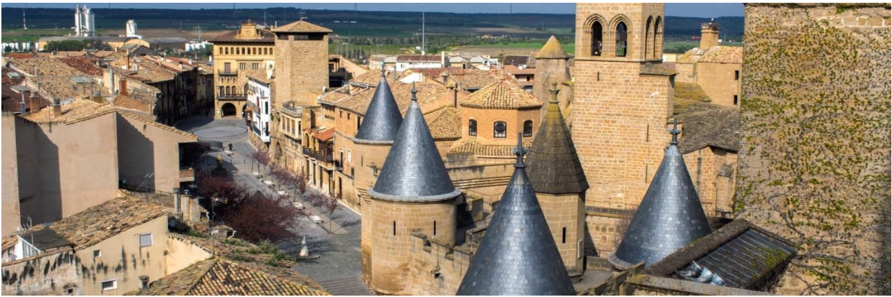
Die Burg von Olite