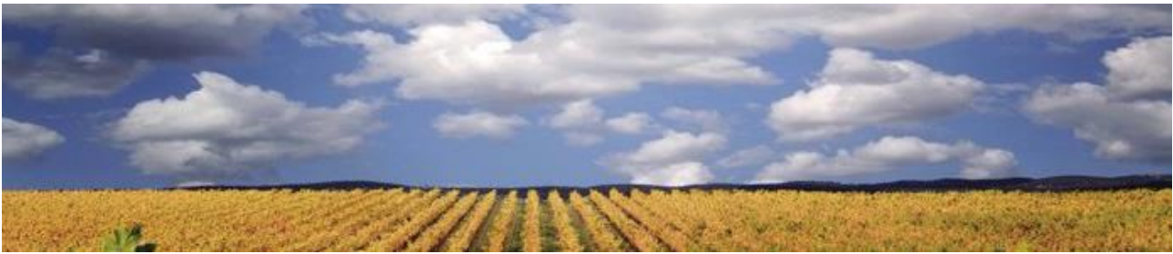
Landschaft in der D.O. Navarra