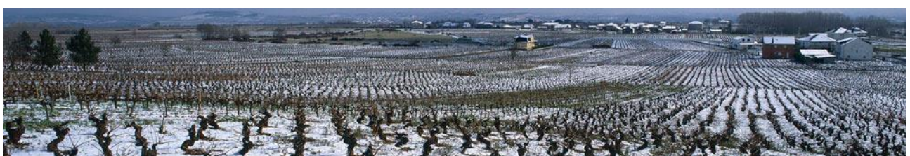
Landschaft in der D.O. Bierzo