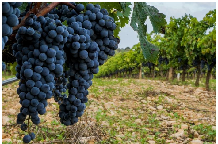
Manto Negro Trauben

Im 20. Jahrhundert ging es aber auch mit dem Wein wieder los. Dann jedoch vor allem mit Rotweinen, insbesondere Manto Negro ( Link ) und Callet ( Link ). Heute zieren zirka 3.000 Hektar Rebfläche das Land. Übrigens der Malvasia erlebte erst wieder seit Kurzem und vor allem durch die Cooperativa Malvasía de Banyalbufarder ( Link ) eine Wiederbelebung. Letztere liegt jedoch im Moment schon wieder eine Pause ein ( Link ). Die jährliche Weinproduktion heute besteht aus rund 80 Prozent Rotwein, 18 % Weisswein und 2 % Süsswein. 40 balearische Rebsorten werden vom Weininstitut IRFAP des Landwirtschaftsministeriums -IRFAP ist das Kürzel vom „Institut de Recerca i Formació Agrària i Pesquera“, dt.: Forschungs- und Ausbildungsinstitut für Landwirtschaft und Fischerei- heute gehegt und gepflegt. Lediglich sechs davon werden allerdings derzeit für die Weinproduktion anerkannt. Weissweine aus Moll = Prensal Blanc ( Link ) oder Perellada ( Link ) bzw. rote Weine aus Callet, Manto Negro (mit über 300 Hektar meistangebaute Sorte), Monastrell und Tempranillo bilden hier die Speerspitze.