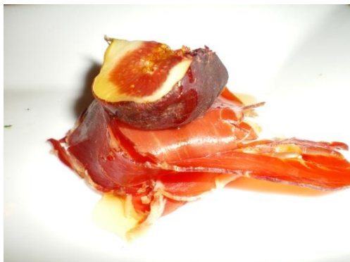
In der Haute Cuisine bezeichnet Einfachheit oft grossartige Speisen. Hier die Tapas Valencia unter zwei Blicken.