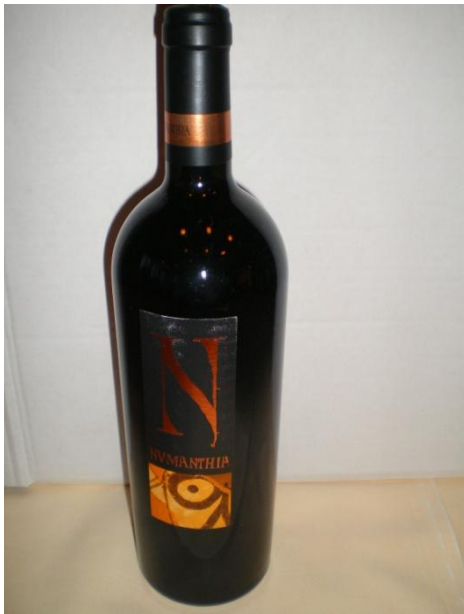
Numanthia gehört wie Yquem, Cheval Blanc, zahlreiche Champagner-Häuser und seit 2008 Quinault l'Enclos dem Bernard Arnault bzw. LVMH

lein... Ausser sie heissen Georg Soros und spekulieren gegen das britischen Pfund.