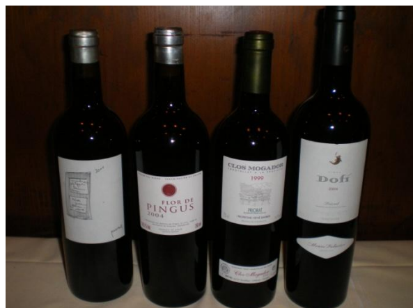
Die Weine der ersten Serie