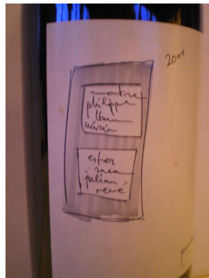
Die Etikette des El Ocho 2001 mit den Vornamen der 8 Winzer, die den Wein zeichnen

wurde, ist nicht klar. Um hervorragende aber auch sehr typische Weine zu erzeugen, müssen die Carignan Rebstöcke sehr alt (mindestens 70 Jahre alt, gemäss der Erfahrung verschiedener französischer Winzer, sein). Und genau 70 Jahre alt sind die Rebstöcke der 8 Freunde, die zusammen diesen Wein ausbauen. Vielleicht lag am Abend der Verkostung das Problem in der Tatsache, dass der 2001 der erste Jahrgang dieses Weins war. Spannend... Die Flasche konnte auch nicht in Frage gestellt werden, es handelte sich da um den besten El Ocho 2001, den ich in den letzten 4 Jahren getrunken habe. Flor de Pingus schlug auch den Finca Dofi 2004 ( Alvaro Palacios ) und den Clos Mogador 1999.