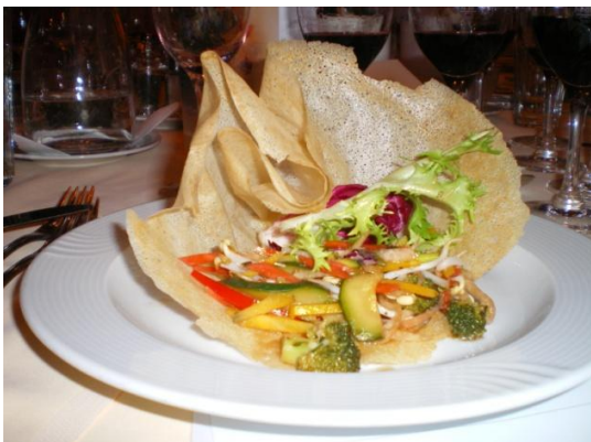
Der warme Gemüsesalat an Himbeerendressing im Brikteig

Aalto PS und Numanthia sind Weine, wie jede und jeder nur davon träumen darf. Eine spezifische Selektion (PS bedeutet Pagos Seleccionados und hat nichts mit Porsche Superieur zu tun), eine Flasche fürs morgendliche Fitnesstraining... Kaufen Sie beide, solange es diese noch gibt und vergessen Sie die mit Schweiß angeschafften Flaschen irgendwo im Keller. A propos: Die Franzosen sprechen von Flacons; genau so wie für ein Parfum. Mit diesen zwei Weinen nimmt der Begriff seine ganze Bedeutung wahr. Bombastisch!