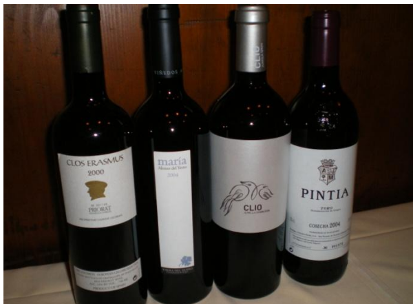
Marcel Proust hat „Auf der Suche nach der verlorenen Zeit“ geschrieben. Mit solchen Weinen enthüllt Spanien seine Lebenssucht.