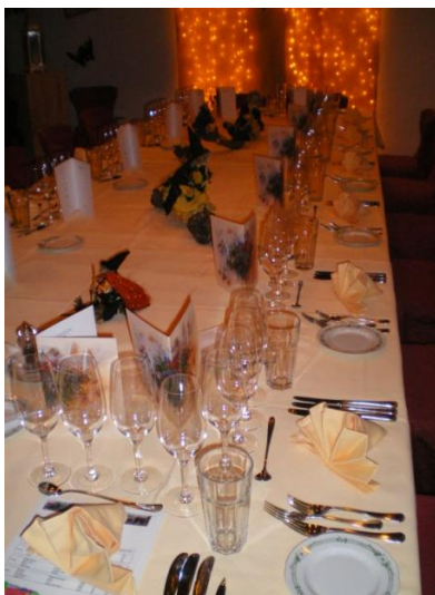
An diesem Tisch fand der Anlass statt