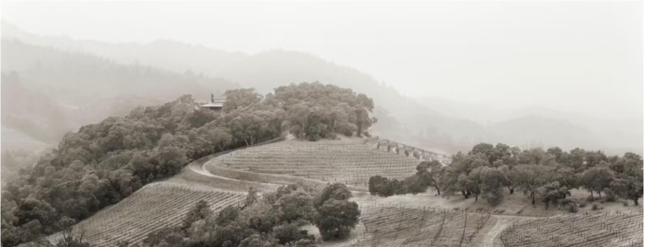
Das Harlan Estate und Weinberge, Blick nach Nordwesten vom oberen Olivenhain