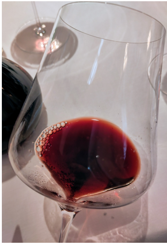
Der Jahrgang 1995